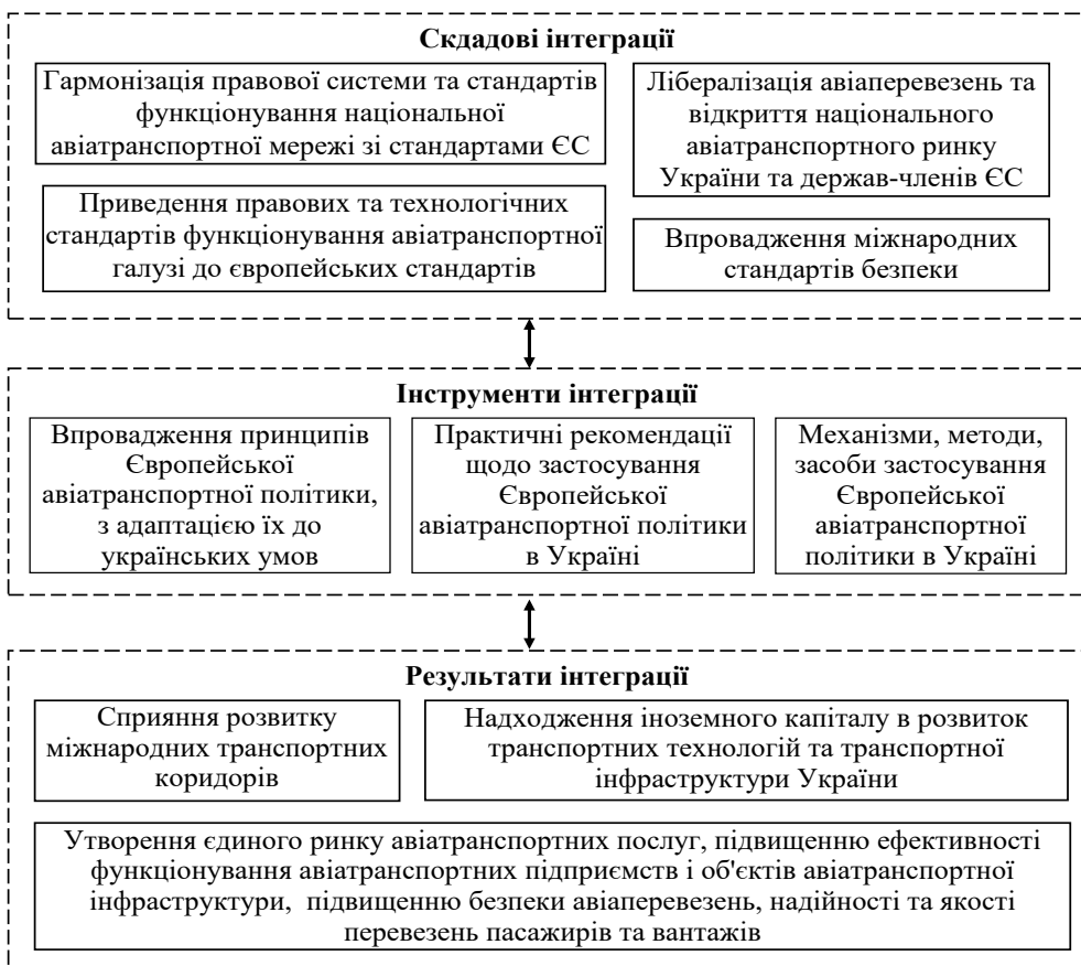
Рис. 2. Система інтеграції авіатранспортної системи до авіатранспортної системи ЄС